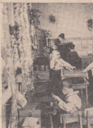
Снимок этот сделан в Дзержинском детском доме. Здесь воспитываются ребята, которым нет еще и семи. А всего их в детдоме 75. И каждый не скушает: можно поиграть в детский бильярд, посмотреть

книжки с интересными картинками, построить дом, не настоящий, правда, из кубиков. Игрушки, игрушки. Их много. Бывая в детдоме, порой очень интересно наблюдать,